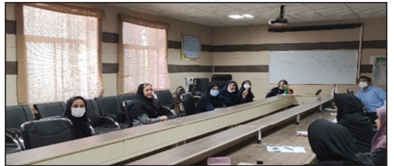
کمیته آموزش مرکز بهداشت شهرستان ایلام با حضور مدیر و مربیان مرکز آموزش بهورزی و بازآموزی برنامه های سلامت و مسئولین واحدهای

ضمن تشکر و خیر مقدم، سخانی را در خصوص اهمیت آموزش نیروها ایراد نمود. ایشان بیان داشت: تغییرات فن آوری سبب دگرگونی در شبکه ها و روش های سازمان می شود و هر تغییری، کسب دانش و مهارت های جدید را ضروری می سازد. با همه سختی ها و مشکلات باید پذیرفت که ادامه حیات سازمان تا حدود زیادی به دانش، آگاهی و مهارت های گوناگون و جدید بستگی دارد. هرچه دانش و مهارت های کارکنان با نیازهای جامعه و پیشرفت های علمی و تغییرات فن آوری هماهنگی و انطباق بیشتری داشته باشد درجه اطمینان از موفقیت فرد و سازمان بالاتر می رود. گاهی اوقات، رشد فردی، داشتن انگیزه، تخصص و رهبریز از ایستایی و رکود فرد عامل اساسی نوجویی و کسب دانش می شود. اساس بهسازی سازمانی (که به نام های دیگری چون توسعه و بالندگی سازمانی