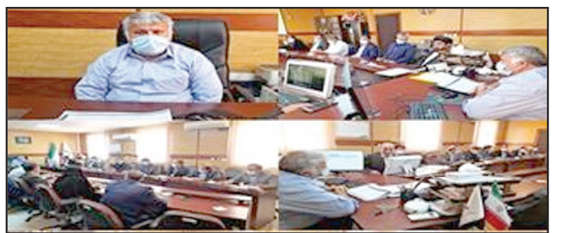
دومین جلسه هیئت رئیسه دانشگاه علوم پزشکی ایلام در سال ۱۴۰۱ با حضور سرپرست دانشگاه، معاونین، مدیران ستادی و سایر اعضا؛ سومین جلسه کمیته بهداشت و درمان اربعین حسینی در دانشگاه در سال ۱۴۰۱ در دانشگاه علوم پزشکی ایلام برگزار شد.

به گزارش روابط عمومی دانشگاه علوم پزشکی ایلام، در ابتدای این جلسه سرپرست دانشگاه علوم پزشکی ایلام ضمن تسلیت رحلت جانسوز نبیائنگار کبیر انقلاب اسلامی حضرت امام خمینی (ره) و گرامیداشت قیام خونین ۱۵ خرداد؛ به اهمیت و جایگاه اربعین حسینی در فصل گرما بین مسلمانین و مردم ایران اسلامی اشاره کرد و گفت: برای اینکه بتوانیم خدمات رضایت بخشی