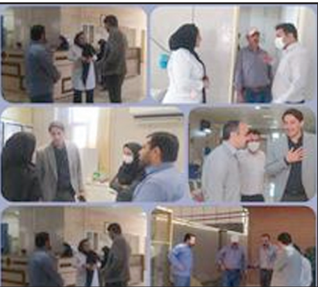
بدره مورد بررسی و ارزیابی قرار گرفت.